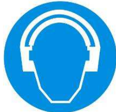
Protezione obbligatoria dell'udito