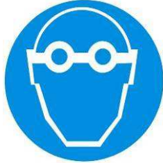
Protezione obbligatoria degli occhi