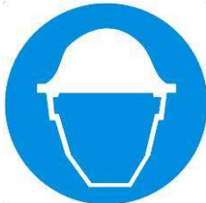
Casco di protezione obbligatoria