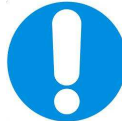
Obbligo generico (con eventuale cartello supplementare)