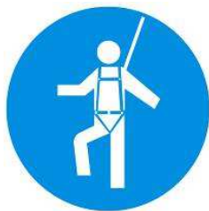
Protezione individuale contro le cadute