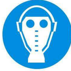
Protezione obbligatoria delle vie respiratorie