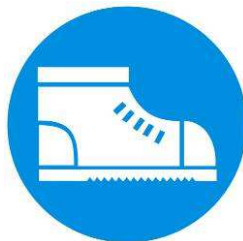
Calzature di sicurezza obbligatoria