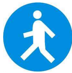
Passaggio obbligatorio per i pedoni