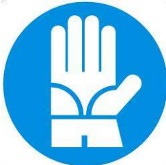
Guanti di protezione obbligatoria