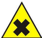
Sostanze nocive / irritanti