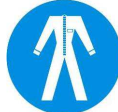
Protezione obbligatoria del corpo