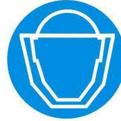
Protezione obbligatoria del viso